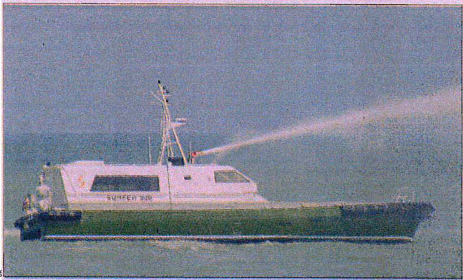
Le Surfer, navire rapide destiné aux plates-formes pétrolières.

Née en 1984 à Dieppe, l'entreprise de construction navale, spécialisée dans le navire rapide en aluminium, poursuit sa route originale. Depuis 1987, elle vit des commandes de Surfer par le groupe Bourbon (100 % de son chiffre d'affaire en 2006), ces navires rapides